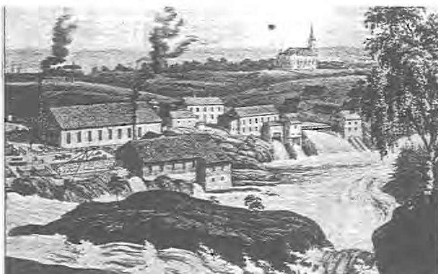
Att framställa massa genom slipning av trä mot roterande stenar var en epokgörande uppfinning på 1840-talet. Ett av världens första träsliperier anlades på Öman, en ö vid Trollhättan, år 1857.