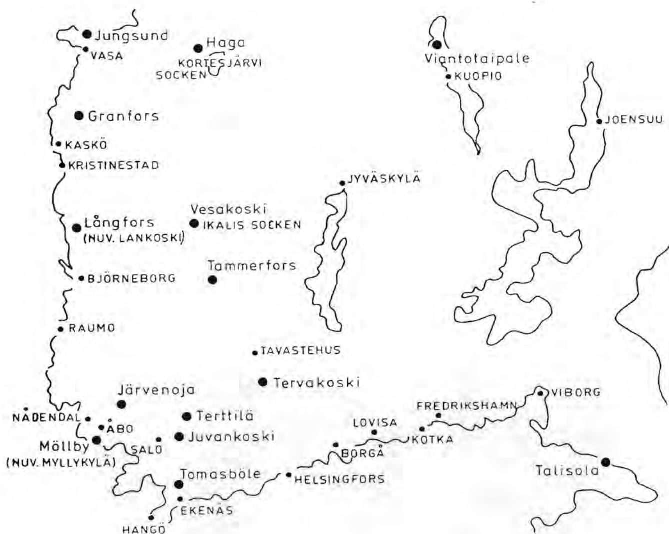
Karta över handpappersbruken i Finland. Suomen käsipaperitehtaiden sijainti. Map of hand-paper mills in Finland.

Ur nordisk synpunkt är det intressant att konstatera att praktiskt taget alla böcker och artiklar kring pappershistoriska frågor i Finland är skrivna på svenska, dvs författade av personer tillhörande den relativt begränsade svenskspråkiga befolkningsgruppen i vårt land. Materialet är alltså lätt tillgängligt för våra nordiska pappershistorikerkollegor.