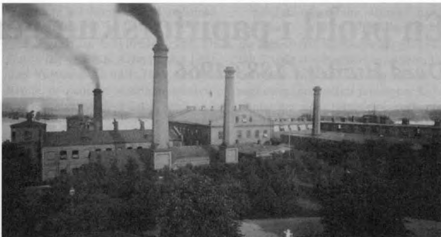
Vy över pappersbruket 1889.