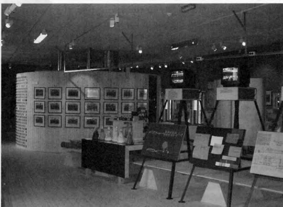
Det första rummet en besökare kommer in i på museet är "röda rummet". Utställningen handlar här om tekniken, produkterna och arbetarna.