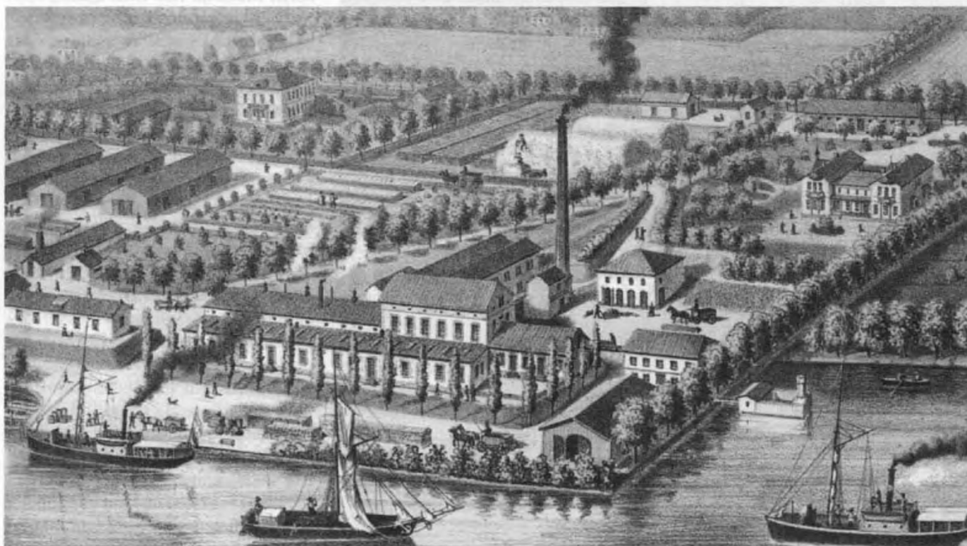
Munksjö pappersbruk på 1870-talet, efter litografi.

I centrala Jönköping längs gamla E4:an och Munksjön, ligger Munksjö AB:s huvudkontor sedan mera än 140 år. Hösten 1999 invigdes Munksjö Museum av dåvarande landshövdingen Birgit Friggebo. Museet, som är öppet för allmänheten, speglar företagets historia från 1862 fram till millenieskiftet.