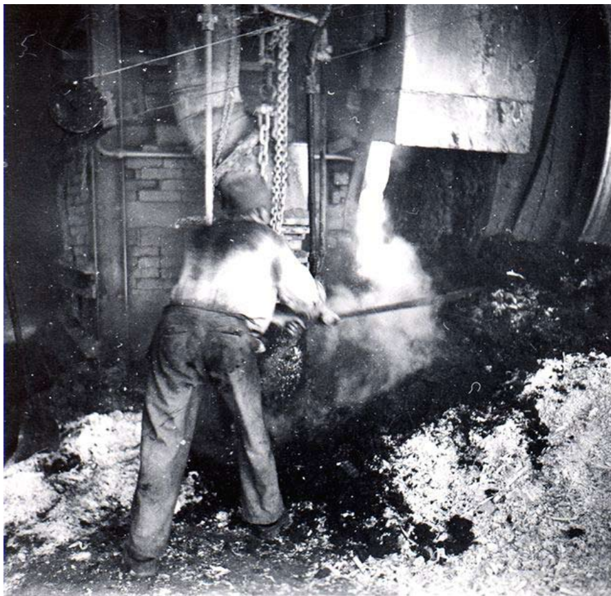
”Nog visste jag att ni var ett stort och mäktigt företag, men att ni hade ett eget helvete, det hade jag verkligen ingen aning om.” Klassisk kommentar från besökande i sulfatfabrikens sodahus.

När förhandlingarna om 1931 års lokalavtal för Marma sulfatfabrik inleddes på hösten 1930 var det i en atmosfär som – åtminstone i arbetsgivarnas värld – var helt präglad av depressionen. Produktionen vid var inställd sedan mitten av augusti, ungarlarna var permitterade (vil-