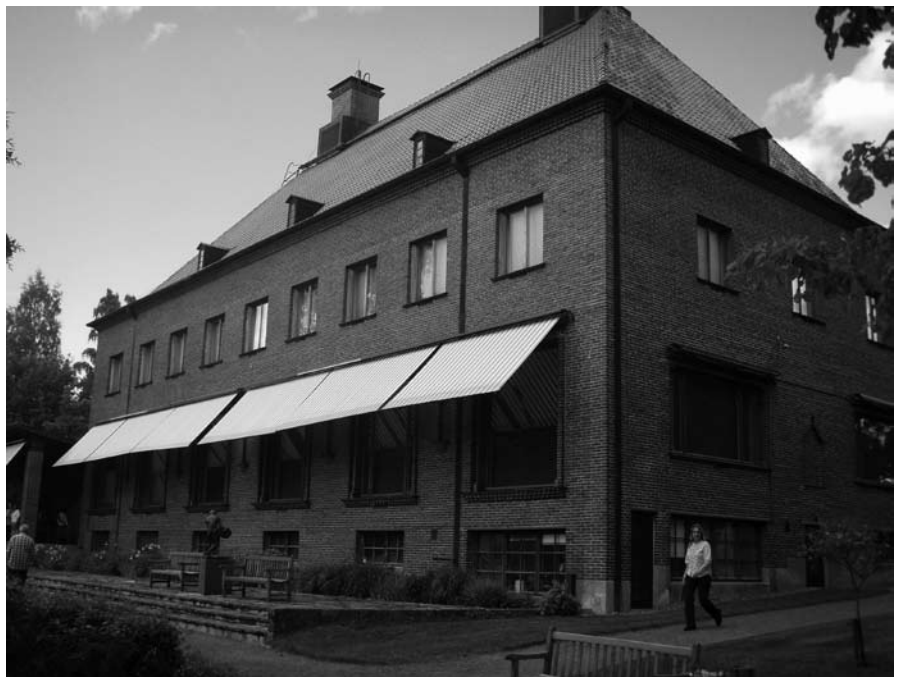
Museet Gösta vid stranden av sjön Melasjärvi.

Efter en lunch i Förvaltarens bostad på andra sidan den stora gårdsplanen