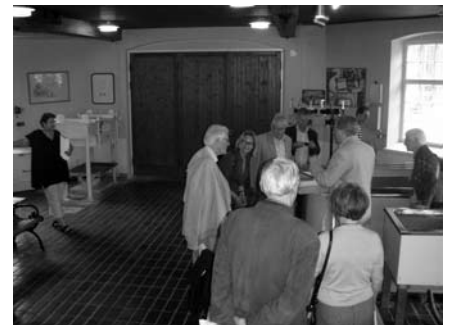
NPH besöker Tervakoskis handpappersbruk.

När vi gick ut till bussen igen kom de första regndropparna, men vad gjorde väl det? Sådana trivialiteter kunde inte ändra intrycket av tre väldigt informa-