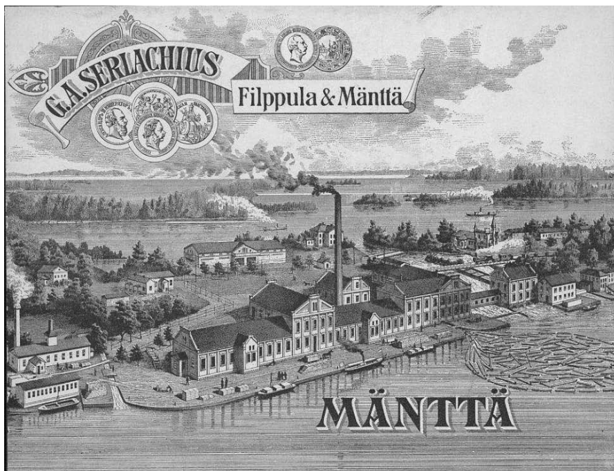
Pappersbruket i Mänttä år 1896. Bilden har bl.a. använts på pärmen av fabriken's mönsterbok.

Såväl den importerade som den till landet på egen hand inflytna handelsbildningen tjänade näringslivet, men av