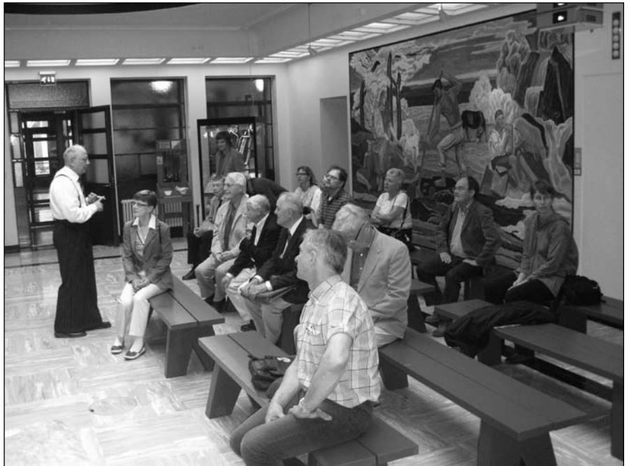
NPH:s medlemmar lyssnar till en engagerad beskrivning av museet Gustaf.