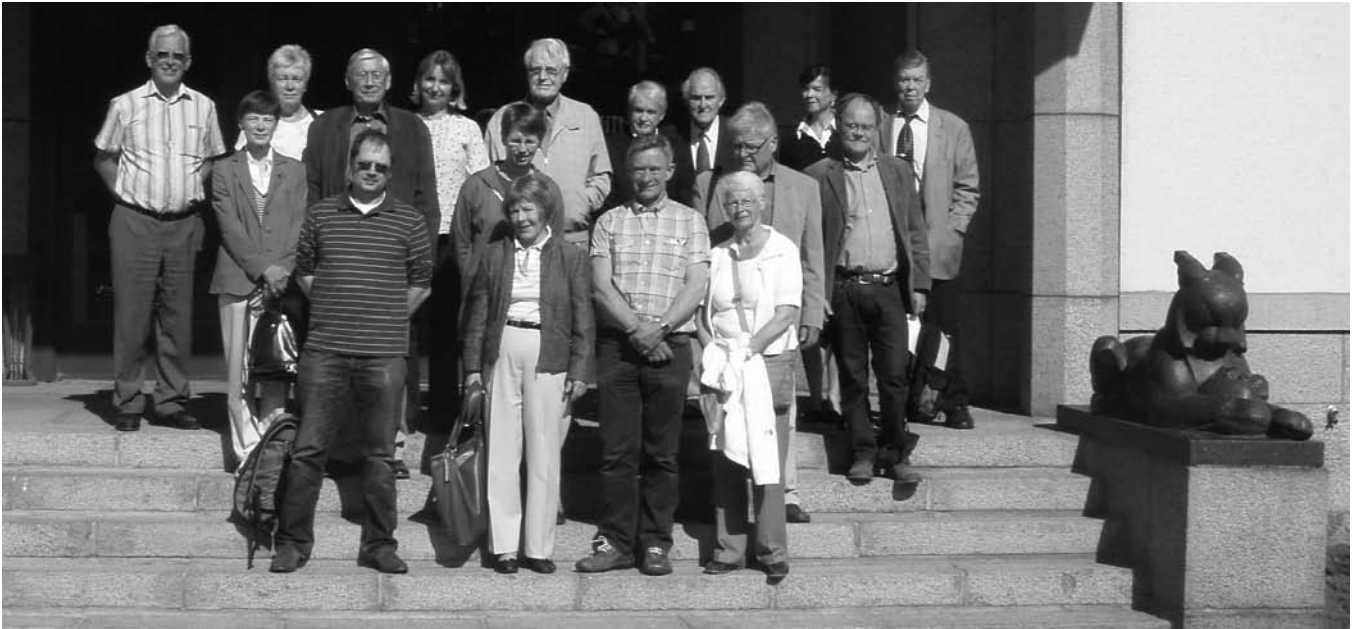
NPH:s årsmötesdeltagare år 2010, på trappan till Vita Huset i Mänttä. Foto: Bertil Mark (bilden är beskuren)

framför Gösta, guidades vi runt i de tio salarna där alla de stora konstnärnamnen fanns med! Gå gärna in på länken och kolla: http://www.serlachius.fi/en.php?k=160661 Det var ett väldigt spännande besök för konstintresserade, som gav mersmak för de stora Finska konstnärerna.