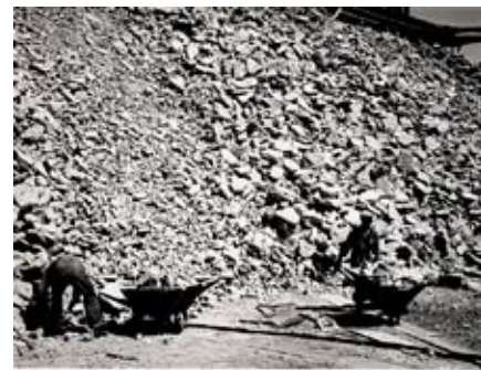
Logistiken för råvaruförsörjningen var under 1920-talet i stor utsträckning manuellt baserad. Här: Sulfittfabrikens kalkstenslager.

Inom skogsindustrin bjuder kampen mellan SAC och LO på ett par märkliga ödets ironier. Den ena var LS-för-