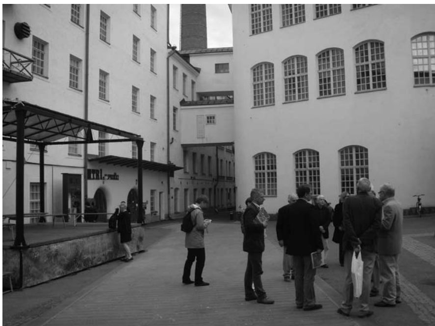
NPH:s medlemmar betraktar det Frenckellska industriområdet i Tammerfors.

Alla samlades efter inkvartering och styrelsens möte på Hotel Cumulus Koskikatu, för ett besök i den vackra och ståtliga Domkyrkan.