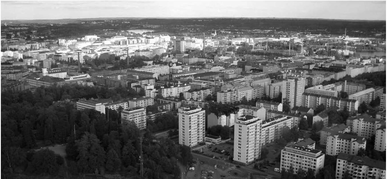
Utsikt över Tammerfors från den roterande Restauranten Näsinneula beläget 124 m upp i det 168 m höga tornet med samma namn. Foto: Bertil Mark (bilden är beskuren)